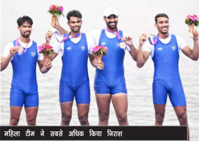
महिला टीम ने सबसे अधिक किया निराश