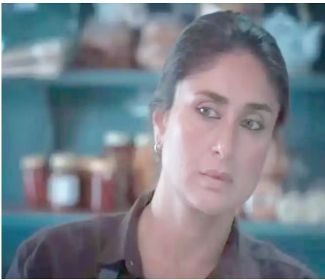
एजेंसी (वेब वार्ता न्यूज)

करीना ने आगे कहा, हां, पू और गीत जैसे किरदार ब्लॉकबस्टर