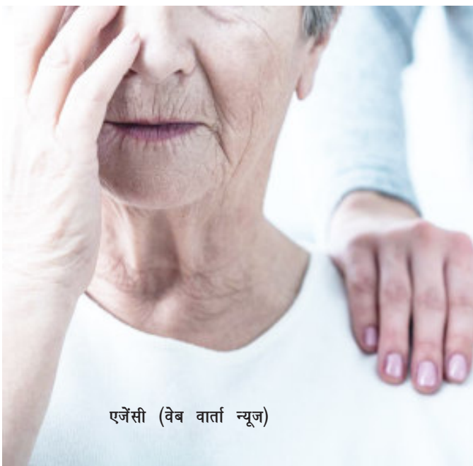
एजेंसी (वेब वार्ता न्यूज)

स्वाद में होने वाले परिवर्तन के कारण हो सकता है। अल्जाइमर रोगियों का वजन कम होने के कारण कुपोषण एवं स्वास्थ्य की अन्य समस्याएं हो सकती हैं। अल्जाइमर से व्यक्ति की स्वाद लेने और सूंघने की क्षमता प्रभावित हो सकती है। इस कारण उसकी भूख घट सकती है या उसे कुछ स्वाद ज्यादा पसंद आने लग सकते हैं, जिससे उसका आहार कम और असंतुलित हो सकता है। कुछ अल्जाइमर रोगी खाना-खाना ही भूल जाते हैं, या खाने के दौरान वो चिंतित या भ्रमित हो जाते हैं, और इस वजह से वो खाना खाने से मना कर देते हैं।