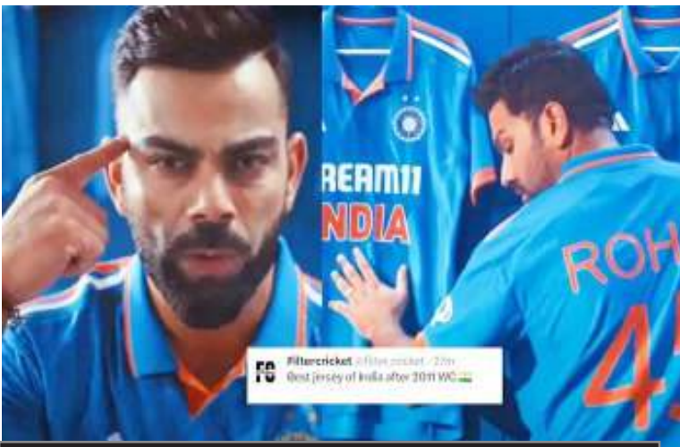
वनडे विश्व कप के आगज में महज 15 दिन का समय बाकी

दरअसल, वनडे विश्व कप 2023 के लिए लॉन्च की गई भारतीय टीम की नई जर्सी में दो स्टार लगे हैं, ऐसा इसलिए क्योंकि वनडे जर्सी 1983 और 2011 विश्व कप में भारत की जीत का प्रतीक है। भारतीय टीम ने 50 ओवर में दो बार खिताब जीता है, इसलिए जर्सी पर दो स्टार लगे हुए नजर आ रहे हैं। जर्सी के कंधों पर तीन सफेद रंग से लाइन की जगह तिरंगे को शामिल किया गया है, जो कि फैंस को काफी पसंद आ रहा है। कुछ फैंस का कहना है कि ये आईसीसी द्वारा लॉन्च किए गए विश्व कप के एंथम सॉन्ग से बढ़िया वीडियो है।