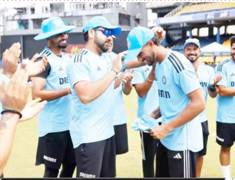
विराट समेत ये खिलाड़ी बाहर

भारतीय टीम की प्लेइंग इलेवन से विराट कोहली, जसप्रीत बुमराह, मोहम्मद सिराज, हार्दिक पंड्या और कुलदीप यादव को बाहर किया गया है। उनकी जगह सूर्यकुमार यादव, मोहम्मद शमी, तिलक वर्मा, प्रसिद्ध कृष्णा और शार्दुल ठाकुर टीम में आए हैं।