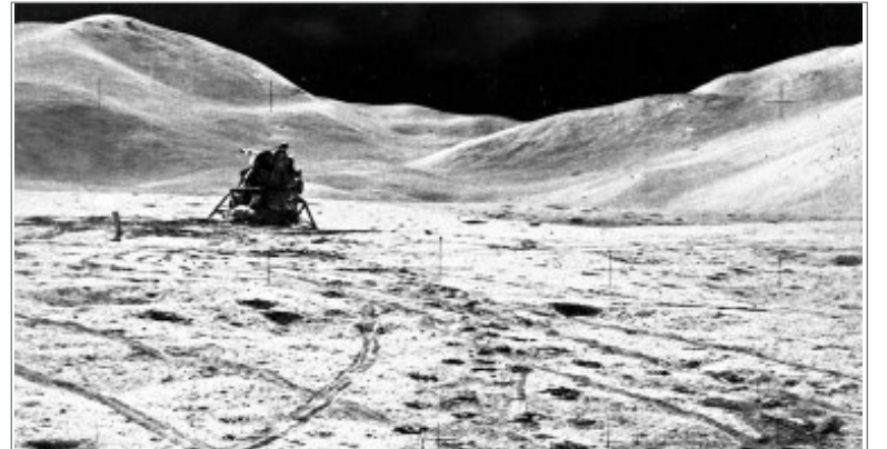
अपोलो मिशन के लैंडर से चंद्रमा पर लगे झटके

समाचार एजेसी ने गुरुवार को बताया था कि रक्षा मंत्री ली पिछले हफ्ते अपनी विधतनाम के रक्षा नेताओं के साथ बैठक से अचानक बाहर निकल गए थे। उन्हें आखिरी बार 29 अगस्त को बीजिंग में अफ्रीकी देशों के साथ एक सुरक्षा मंच पर मुख्य भाषण देते हुए देखा गया था।