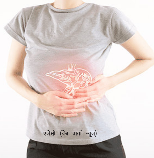
एजेंसी (वेब वार्ता न्यूज)