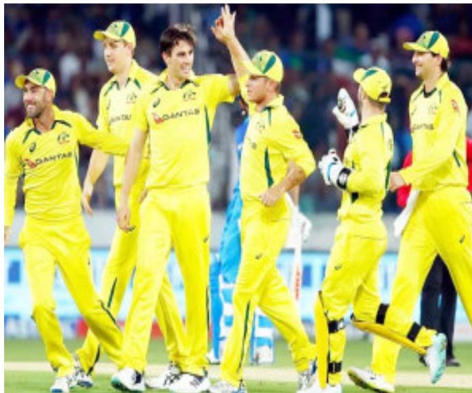
होना पड़ा था।

घरेलू और अंतरराष्ट्रीय क्रिकेट खेलने वाले सभी खिलाड़ियों को पहनने होंगे नेक गार्ड