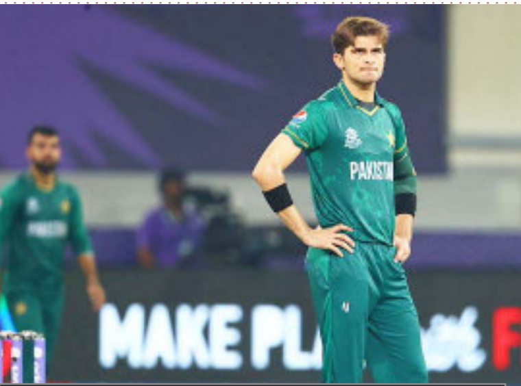
टॉस जीतने के बाद गेंदबाजी चुनने पर भी बोले अफरीदी

शाहिद ने प्रशंसकों की ओर से उठाए गए सवाल का भी जवाब दिया कि टीम ने टॉस जीतकर पहले बल्लेबाजी क्यों नहीं चुनी। उन्होंने कहा— अगर हमने ठीक से गेंदबाजी की होती तो, जैसे नसीम शाह ने पारी की शुरुआत में गेंदबाजी की, मामला अलग होता। शाहीन को भी नसीम की तरह गेंदबाजी करनी चाहिए थी, लेकिन उनकी लाइन और लेंथ सही नहीं थी।