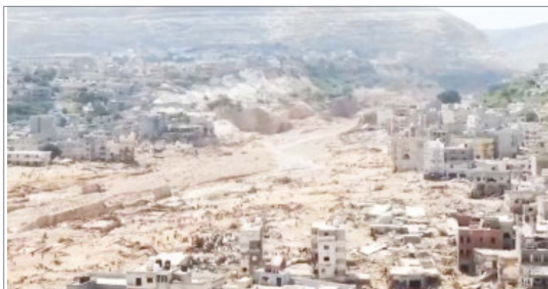
लीबिया की विनाशकारी बाढ़ लील गई 6000 जानें

फिच ने 2023 में ग्लोबल इकॉनमी के ग्रोथ अनुमान को 0.1 परसेंट बढ़ाकर 2.5 परसेंट कर दिया है। लेकिन उसका साथ ही कहना है कि चीन में रियल एस्टेट का संकट दुनिया पर भारी पड़ सकता है। उसने कहा, 'चीन के हाउसिंग मार्केट के पटरी पर लौटने की उम्मीद की जा रही थी लेकिन ऐसा नहीं हुआ है। चीन ने हाउसिंग सेक्टर में भारी निवेश किया है और वहां की इकॉनमी में इसकी 12 परसेंट हिस्सेदारी है।