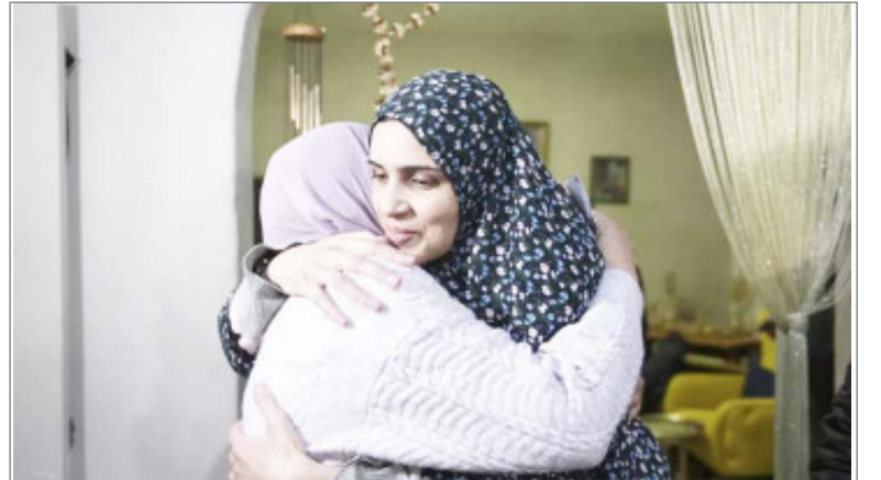
फलस्तीनी कैदियों की रिहाई पर जश्न मनाते दिखे लोग