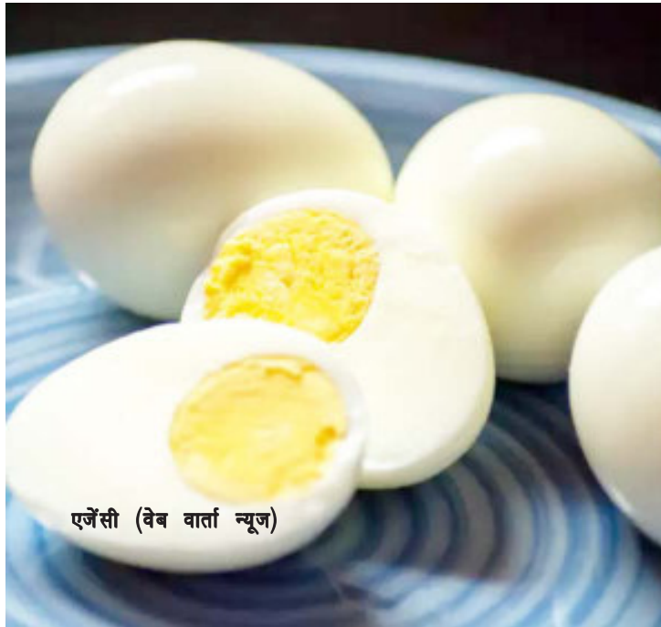
एजेसी (वेब वार्ता न्यूज)

अंडे में मौजूद पोषक गुणों के कारण लोग इसे खाना पसंद करते हैं। कुछ लोग उबला अंडा पसंद करते हैं, तो वहीं कुछ इसका ऑमलेट बनाकर खाते हैं, लेकिन बहुत कम लोग जानते हैं कि इन दोनों तरीकों में से कौन-सा तरीका आपके लिए ज्यादा सेहतमंद है। आज हम इसी सवाल का जवाब दे रहे हैं। अंडे में मौजूद प्रोटीन आपकी मसल्स को रिपेयर करने और उनके ग्रोथ में मदद करता है। अंडे में मौजूद विटामिन डी, बी12 और राइबोफ्लेविन शरीर को विवक एनर्जी पहुंचाते हैं। अंडे में प्रचुर मात्रा में कोलीन होता है, जो