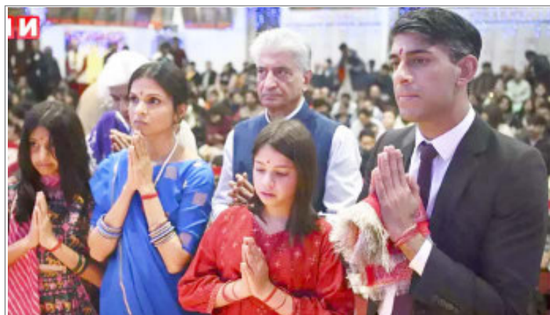
मंदिर में परिवार सहित यूके के पीएम ऋषि सुनक

अमेरिकी रक्षा विभाग ने बताया है कि ईरान के समर्थित आतंकी संगठनों की ओर से किए गए हमलों के जवाब में रक्षा सचिव लॉयड जे. ऑस्टिन ने पैट्रियट मिसाइल सिस्टम और मिडिल ईस्ट में ज्यादा बटालियनों की तैनाती भी शामिल है।