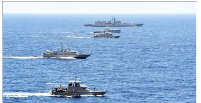
चीन-पाकिस्तान की नेवी ने अरब सागर में संयुक्त अभ्यास किया

भारत ने वापस ले ली थी, जिसके बाद हाल ही में इनको वापस अपने देश लौटना पड़ा। इसके लिए जस्टिन टूडो ने फिर से भारत पर वियना कन्वेंशन के उल्लंघन का आरोप दोहराया है। टूडो ने कहा कि भारत ने वियना कन्वेंशन का उल्लंघन किया और 41 कनाडाई राजनयिकों की राजनयिक छूट को मनमाने ढंग से रद्द कर दिया तो हम बहुत निराश हुए। इसके बारे में हमारे दृष्टिकोण से सोचें। अगर कोई देश यह निर्णय ले सकता है कि दूसरे देश के राजनयिक अब सुरक्षित नहीं हैं, तो यह अंतरराष्ट्रीय संबंधों को और अधिक खतरनाक और अधिक गंभीर बनाता है।