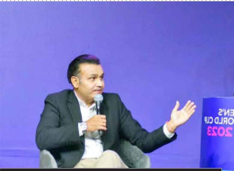
एडुल्जी पहली भारतीय महिला क्रिकेटर

डायना एडुल्जी ने 17 वर्षों तक भारत का प्रतिनिधित्व किया और आईसीसी हॉल ऑफ फेम में शामिल होने वाली पहली भारतीय महिला हैं। उन्होंने भारत के लिए 20 टेस्ट और 34 वनडे खेले हैं और क्रमशः 63 और 46 विकेट हासिल किए हैं। 1993 विश्व कप के बाद जब उन्होंने संन्यास लिया तो केवल लिन फुलस्टन ने अंतरराष्ट्रीय क्रिकेट के में अधिक विकेट लिए थे।