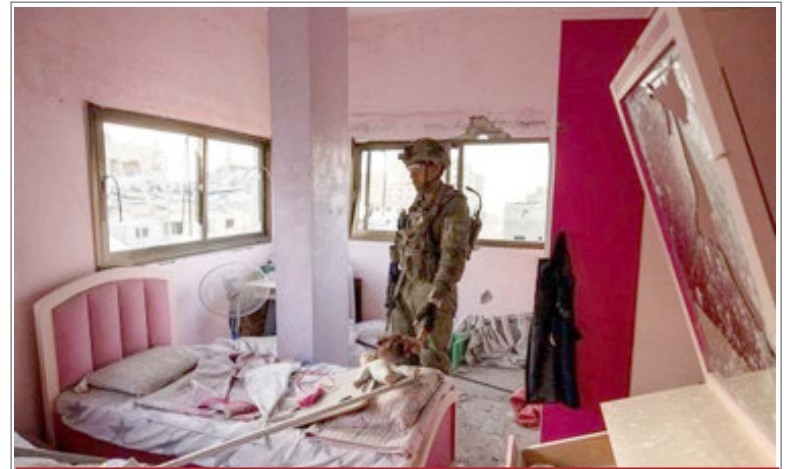
पत्रकारों ने देखी गाजा की वीभत्स तस्वीर

अफगानी धरती का उपयोग पाकिस्तान के खिलाफ करने की अनुमति नहीं दी जाएगी। लेकिन, दुर्भाग्य से अंतरिम अफगान सरकार के सत्ता में आने के बाद से पाकिस्तान में आतंकवादी घटनाओं में 60 प्रतिशत और आत्मघाती हमलों में 500 प्रतिशत की वृद्धि हुई है। उन्होंने आगे कहा कि पिछले दो वर्षों में इस 2,267 निर्दोष नागरिकों की जान चली गई है।