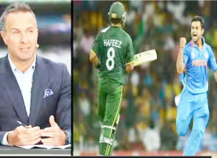
विश्व कप में धमाल मचा रहे हैं विराट कोहली

विश्व कप 2023 में टीम इंडिया के पूर्व कप्तान विराट कोहली अपनी बैटिंग से धमाल मचा रहे हैं। टीम इंडिया के लिए कोहली ने 8 मैचों में दो शतक के साथ 543 रन बना चुके हैं। वहीं विश्व कप में उनके नाम 1573 रन भी दर्ज हो गया। विश्व कप के मुकाबलों विराट कोहली सहबे अधिक रन बनाने के मामले में तीसरे स्थान पर आ गए हैं।