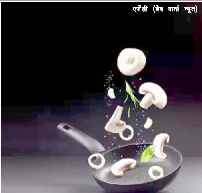
एजेंसी (वेब वार्ता न्यूज)