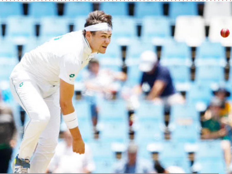
लुंगी एनगिडी को प्लेइंग इलेवन में मिल सकती है जगह

कोएट्जी के बाहर होने से साउथ अफ्रीका दूसरे टेस्ट में लुंगी एनगिडी को टीम में शामिल कर सकती है। बता दें कि भारत और साउथ अफ्रीका के बीच दूसरा टेस्ट मैच 3 जनवरी से केपटाउन में खेला जाएगा। फिलहाल अफ्रीका दो टेस्ट मैच की सीरीज में 1-0 से आगे है।