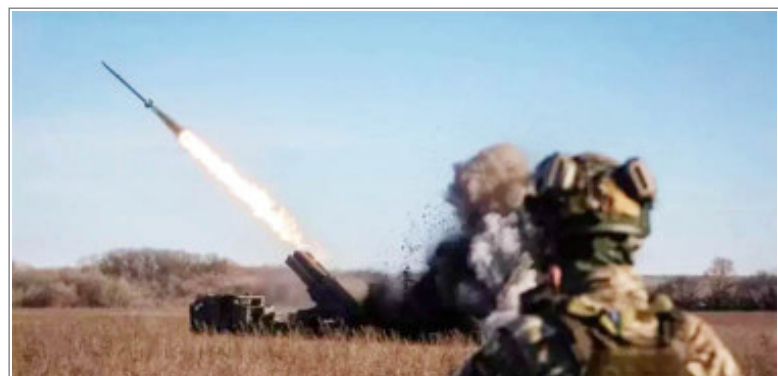
रूस ने पोलैंड के हवाई क्षेत्र का किया उल्लंघन

वायरस कमजोर इम्यूनिटी वाले बच्चों को जल्दी और आसानी से निशाना बनाता है। इसलिए पोलियो टीकाकरण बच्चों को वायरस और विकलांगता से बचाने का एकमात्र तरीका है। स्वास्थ्य मंत्रालय ने कहा कि माता-पिता को प्रत्येक पोलियो अभियान के दौरान पांच साल से कम उम्र के बच्चों को पोलियो ड्रॉप पिलानी चाहिए। विश्व स्वास्थ्य संगठन के अनुसार, पाकिस्तान अपने पड़ोसी अफगानिस्तान के साथ-साथ दुनिया के दो पोलियो से पीड़ित देशों में से एक है। स्वास्थ्य मंत्रालय ने कहा कि पाकिस्तान में इस साल अब तक पोलियो के छह मामले सामने आए हैं।