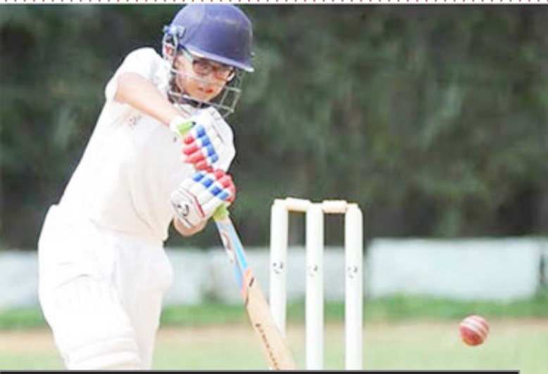
राहुल द्रविड़ भारतीय टीम से जुड़ेंगे

राहुल द्रविड़ दक्षिण अफ्रीका के खिलाफ आगामी टेस्ट सीरीज के लिए भारतीय टीम से जुड़ेंगे। भारत और दक्षिण अफ्रीका के बीच दो मैचों की टेस्ट सीरीज खेली जाएगी। दोनों टीमों के बीच पहला मुकाबला सेंचुरियन के सुपरपोर्ट पार्क में खेला जाएगा। यह मैच 26 से 30 दिसंबर तक खेला जाएगा। इसके बाद दूसरा टेस्ट 3-7 जनवरी तक केंप टाउन के न्यूलैंड्स में खेला जाएगा।