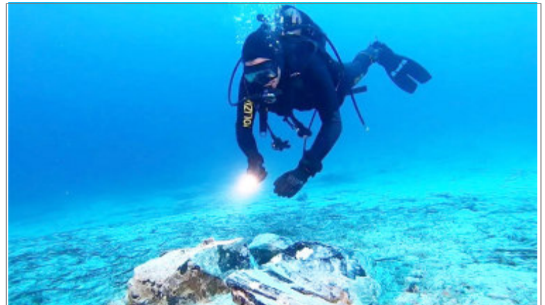
समुद्र के नीचे मिला 4000 साल पुराना पाषाण काल का खजाना

को वीजा फ्री किया है, उसमें रूस भी शामिल है जिसके साथ उसकी दोस्ती इन दिनों अपने चरम पर चल रही है। ईरान के संस्कृति मंत्री इज्जतुल्ला जारघामी ने कहा कि बुधवार को एक सरकारी बैठक के दौरान वीजा की जरूरत को रद्द करने पर सहमति बनी है। ईरान के इस कदम से रूस के नागरिकों को बहुत फायदा होगा जो अभी विदेश जाने में बहुत मुश्किलों का सामना कर रहे हैं। अमेरिका ने यूक्रेन युद्ध की वजह से रूस पर कई तरह के प्रतिबंध लगा दिए हैं। ईरान ने सऊदी अरब के लोगों के लिए भी वीजा की जरूरत को खत्म कर दिया है।