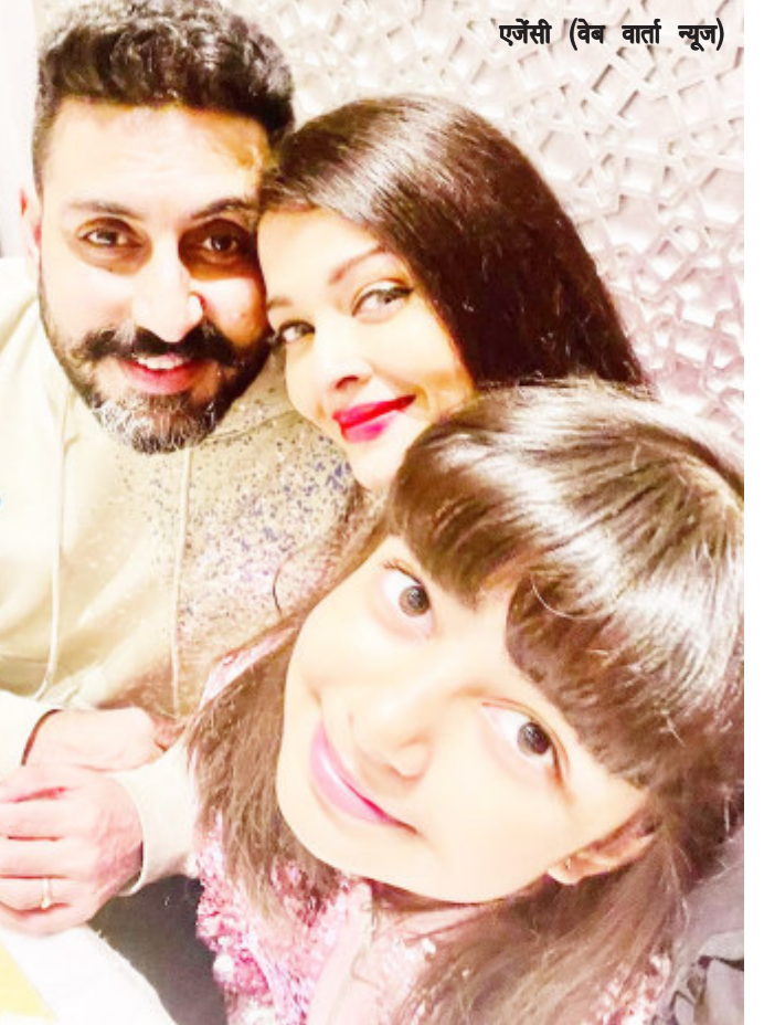
एजेंसी (वेब वार्ता न्यूज)