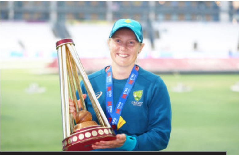
उप कप्तान बनने पर मैक्ग्रा का बयान

मैक्ग्रा ने कहा, 'हीली और मैं लंबे समय से एक साथ खेल रहे हैं। हम अपनी-अपनी नेतृत्व शैली को अच्छी तरह से जानते हैं। मैं अपने समूह का नेतृत्व करने में उनकी मदद करने के लिए उत्सुक हूँ क्योंकि हम एक व्यस्त, लेकिन रोमांचक अंतरराष्ट्रीय कार्यक्रम की ओर बढ़ रहे हैं। क्रिकेट ऑस्ट्रेलिया (सीए) बोर्ड की बैठक में हीली और मैक्ग्रा की नियुक्तियों को मंजूरी दी गई। ऑस्ट्रेलिया के कप्तान के रूप में भारत दौरे के बाद हीली का पहला बड़ा काम अगले साल बांग्लादेश में होने वाला टी20 विश्व कप होगा।