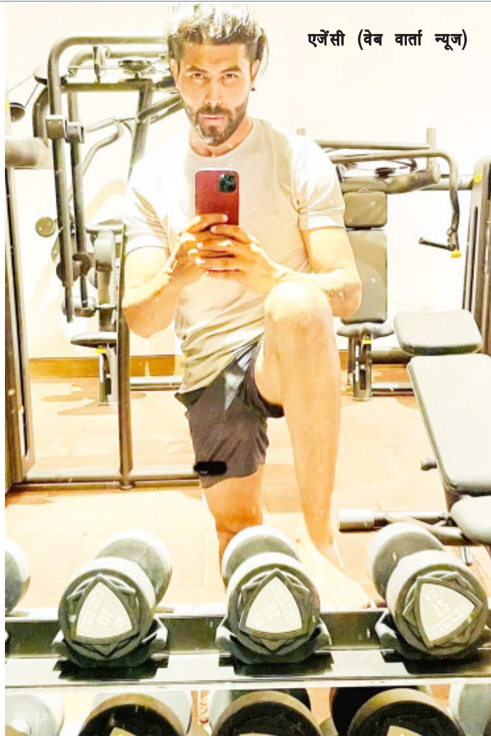
एजेंसी (वेब वार्ता न्यूज)