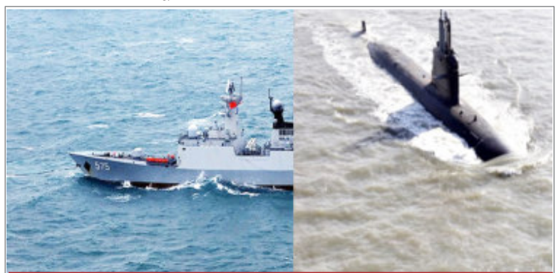
अमेरिकी नौसेना का 5वां बेड़ा पहुंचा फारस की खाड़ी

जारी इन दस्तावेजों को गोपनीय बताया गया है। ये दस्तावेज अमेरिका के ज्वाइंट चीफ ऑफ स्टाफ की ओर से दिए जाने वाले दैनिक विवरण के जैसे प्रतीत होते हैं, जिन्हें सार्वजनिक नहीं किया जाता है। 23 फरवरी से एक मार्च के बीच के इन दस्तावेजों में अमेरिका और नाटो की ओर से यूक्रेन को दिए जाने वाले हथियारों और अन्य सैन्य साजोसामान की मात्रा और समयसीमा के बारे में अधिक सटीक जानकारी देने का दावा किया गया है। हालांकि, दस्तावेजों में युद्ध की योजना के बारे में कोई जानकारी नहीं दी गई है।