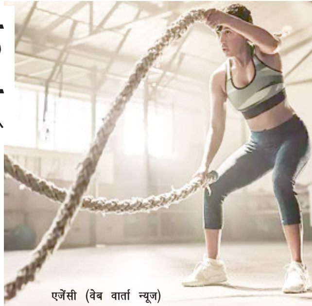
एजेंसी (वेब वार्ता न्यूज)

उसे करनी चाहिए। रक्त अक्सर बैक अप लेता है और फेफड़ों और पैरों में तरल पदार्थ का निर्माण करता है। तरल पदार्थ का निर्माण सांस की तकलीफ और पैरों की सूजन का कारण बन सकता है।