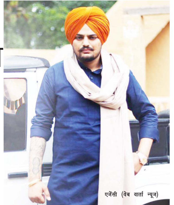
एजेसी (वेब वार्ता न्यूज)