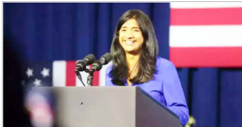
मेरीलैंड की पहली भारतीय-अमेरिकी लेफ्टिनेंट गवर्नर बनीं अरुणा मिलर

लामबंदी अभियान में ५० हजार रूसी सैनिक लड़ रहे लड़ाई: इस बीच, व्लादिमीर पुतिन ने कहा कि उनके लामबंदी अभियान के हिस्से के रूप में बुलाए गए 50,000 रूसी सैनिक अब यूक्रेन में लड़ाकू इकाइयों के साथ लड़ रहे हैं।