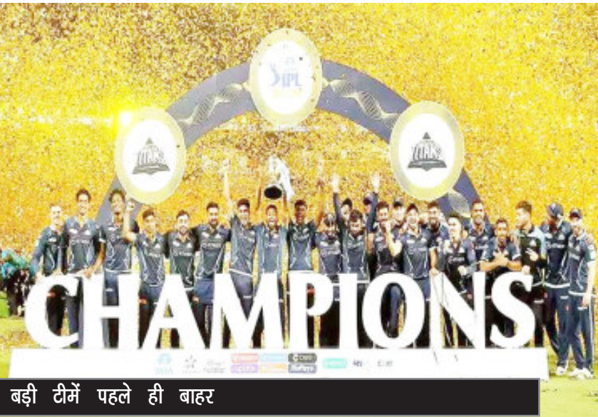
बड़ी टीमों पहले ही बाहर

मुंबई इंडियंस, चेन्नई सुपरकिंग्स और कोलकाता नाइटराइडर्स— आईपीएल के इतिहास में ये तीन टीमों ही एक बार से ज्यादा खिताब जीत पाई हैं। इस बार ये तीनों टीमों काफी पहले ही खिताबी दौर से बाहर हो गई थीं। पांच बार चैंपियन रह चुकी मुंबई इंडियंस तो लीग फेज के आधे मुकाबलों के बाद ही अगले सीजन की तैयारियों में लग गई थी। पूरे सीजन का सबसे नीरस मुकाबला फाइनल में देखने को मिला।