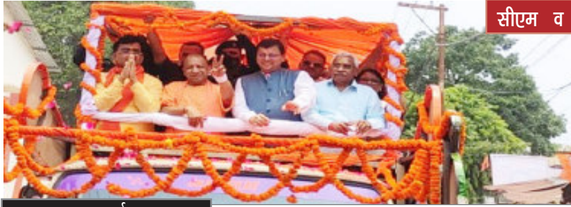
प्रशासन रहा सतर्क

सीएम योगी आदित्यनाथ के उत्तराखंड रोड शो में भी बुलडोजर