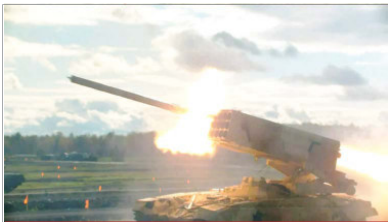
रामायण के अग्निबाण जैसा है पुतिन का थर्मोबेरिक बम!

डेंगू का प्रकोप ऐसे समय पर फैल रहा है जब देश पहले से कोरोना वायरस, मलेरिया और डायरिया जैसी मुश्किलों का सामना कर रहा है। डब्ल्यूएचओ ने एक बयान में कहा कि दर्ज किए गए मामलों को संभवतः कम करके आंका जा रहा है क्योंकि डेंगू के ज्यादातर मामले लक्षणहीन हैं।