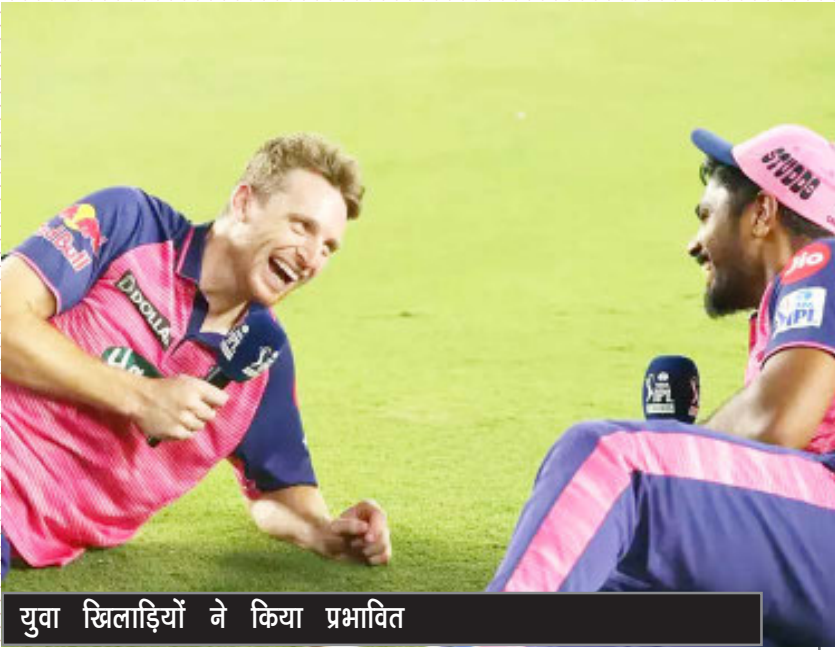
युवा खिलाड़ियों ने किया प्रभावित

रॉयल चैलेंजर्स बेंगलोर (आरसीबी) के कप्तान फॉफ डुलेसी ने कहा, 'हमारा स्कोर थोड़ा कम रह गया। नयी गेंद से खेलना चुनौती भरा था। हमें लगा कि 180 रन का स्कोर अच्छा होगा। लेकिन इतना स्कोर नहीं बना सके। युवा खिलाड़ियों ने प्रभावित किया।'