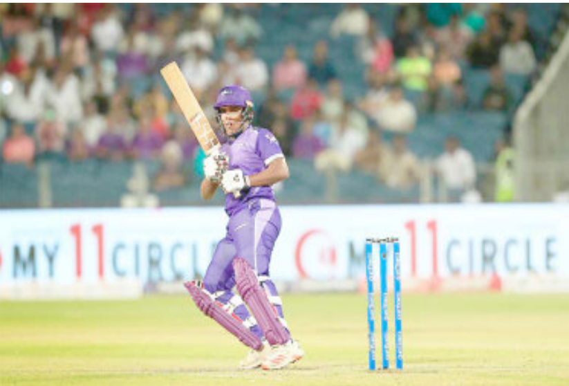
मैच खत्म करना पसंद है