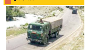
सात जवानों की जान गई, 19 घायल

सेना के जवानों ने मिलकर रेस्क्यू ऑपरेशन चलाया। नदी में गिरे सभी जवानों को निकाला गया। इनमें से सात जवानों की मौके पर ही मौत हो चुकी थी। बाकी 19 घायलों में कई की हालत गंभीर है। सभी को पहले परतापुर के 403 फील्ड अस्पताल पहुंचाया गया। प्राथमिक उपचार के बाद इनमें से कुछ को बेहतर इलाज के लिए शिफ्ट किए जाने की भी खबर मिल रही है। मृतक जवान और घायलों के नाम और पते की जानकारी अभी नहीं मिली है। हादसे के बारे में विस्तृत जानकारी अभी प्रतीक्षारत है।