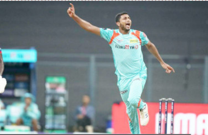
यूपी के लोग मुझे देखते होंगे

मैं काफी खुश हूँ। नीलामी से पहले भी सोच रहा था कि मेरा चयन लखनऊ की टीम में हो जाए और हुआ भी ऐसा ही। मैं काफी खुश हूँ क्योंकि मैं अपनी स्थानीय टीम से आईपीएल टीम में आया हूँ। मुझे अच्छा लगा कि मैं इस टीम के लिए खेल रहा हूँ और मैं सोचता हूँ कि यूपी के लोग मुझे देखते होंगे। मेरे दिमाग में ऐसा कुछ नहीं रहता है कि चयनकर्ताओं की नजर मेरे ऊपर है। मैं सिर्फ यही सोचता हूँ कि जैसा मेरा प्रदर्शन चल रहा है, आगे भी वैसा ही चलता रहे।