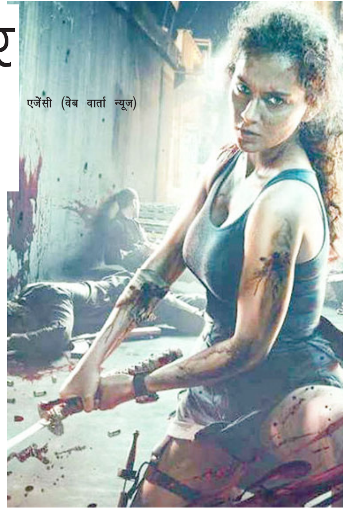
एजेंसी (वेब वार्ता न्यूज)

जिस हिसाब से कमा रही है, यह लाइफटाइम 10 करोड़ भी कमा ले तो गनीमत है। ऐसे में फिल्म को हुए घाटे का अंदाजा लगाया जा सकता है। धाकड़ की कमाई ओपनिंग डे से ही बेकार रही है। शनिवार और रविवार को कमाई बढ़ने की बजाय घट गई। इस फिल्म ने ओपनिंग डे पर शुक्रवार को 1.25 करोड़ रुपये कमाए थे। शनिवार को कमाई घटकर 1.05 करोड़ रुपये हो गई। जबकि रविवार को कमाई महज 97 लाख रुपये थी। अब सोमवार को कमाई का आंकड़ा 30 लाख है। फिल्म किस हद तक पिटी है, इसका अंदाजा घटती कमाई की रफ्तार को देखकर लगाया जा सकता है।