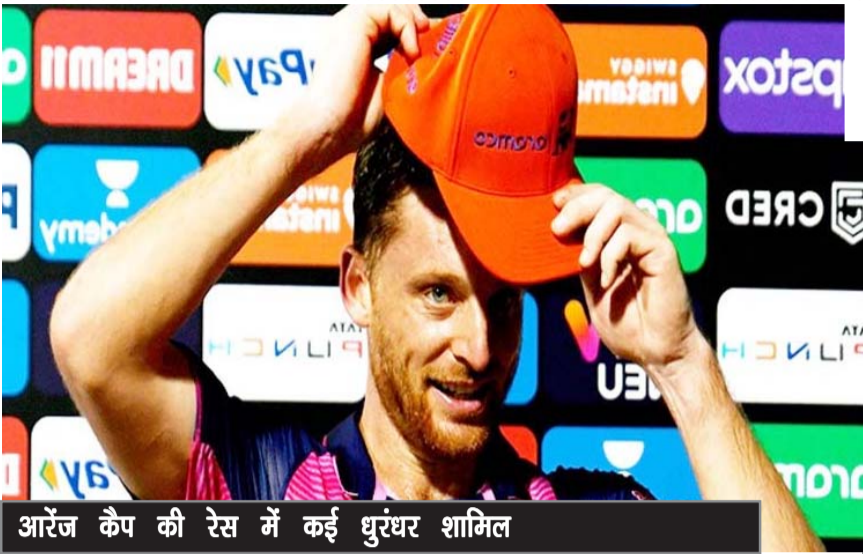
आरंज कैप की रेस में कई धुरंधर शामिल

दिल्ली के ओपनर डेविड वार्नर छठे नंबर पर खिसक गए हैं। अब उनके खाते में 9 मैचों में 375 रन हो गए हैं। 7वें नंबर पर लखनऊ के ओपनर विवंटन डीकाक की एंट्री हुई है। गुजरात के खिलाफ मैच में उन्होंने 11 रन की पारी खेली और अपने रनों की संख्या को 355 तक पहुंचा दिया है। 8वें नंबर पर लखनऊ के बल्लेबाज दीपक हुड्डा ने जगह बना ली है। गुजरात के खिलाफ मैच में उन्होंने 27 रन की पारी खेलकर अपने रनों की संख्या को 347 कर लिया है। 9वें और 10वें नंबर पर क्रमशः गुजरात के कप्तान हार्दिक पांड्या और कोलकाता के कप्तान श्रेयस अय्यर हैं।