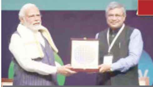
अल्लूरी सीताराम की जीवन यात्रा एक प्रेरणा स्रोत

भीमावरम। प्रधानमंत्री मोदी आंध्र प्रदेश के भीमावरम में अल्लूरी सीताराम राजू के 125वीं जयंती पर साल भर तक चलने वाले समारोह में शामिल हुए। समारोह को संबोधित करते हुए पीएम ने स्वतंत्रता सेनानी अल्लूरी सीताराम राजू को एक भारत श्रेष्ठ भारत की भावना का प्रतीक बताया।