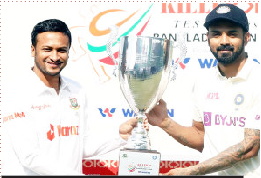
रोहित शर्मा के इंजरी पर केएल राहुल

केएल राहुल से जब रोहित शर्मा के इंजरी के बारे में पूछा गया तो उन्होंने कहा कि श्रोहित हमारे लिए महत्वपूर्ण खिलाड़ी हैं। वह अनुभवी खिलाड़ी हैं और हमारे टीम के कप्तान हैं। वह ऐसे खिलाड़ी हैं जिसे टीम मिस करेगी। हम आशा करते हैं कि वह जल्द रिकवर करेंगे और दूसरे टेस्ट के लिए टीम से जुड़ेंगे।