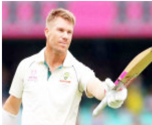
बोले- कप्तानी से नहीं हटेगा बैन

उन्होंने चैनल नाइन के 'वाइड वर्ल्ड ऑफ स्पोर्ट्स' कार्यक्रम में कहा, 'क्रिकेट ऑस्ट्रेलिया अगर वॉर्नर के कप्तानी करने पर लगा प्रतिबंध हटा भी देता है तो उससे क्या होगा। वॉर्नर को किसी भी