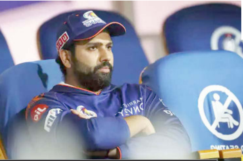
क्या छोड़ेंगे कप्तानी?

चेन्नई की टीम हालांकि अब भी प्लेऑफ की दौड़ से बाहर नहीं हुई है। आईपीएल की बड़ी नीलामी में मुंबई ने हार्दिक पंड्या और कृणाल पंड्या को अपने साथ बरकरार नहीं रखा जिन्होंने पिछले कुछ वर्षों में टीम की सफलता में अहम भूमिका निभाई थी। मुंबई ने कप्तान रोहित के अलावा सूर्यकुमार यादव, जसप्रीत बुमराह और कीरोन पोलार्ड को रिटैन किया था लेकिन ये उम्मीद के मुताबिक प्रदर्शन नहीं कर पाए।