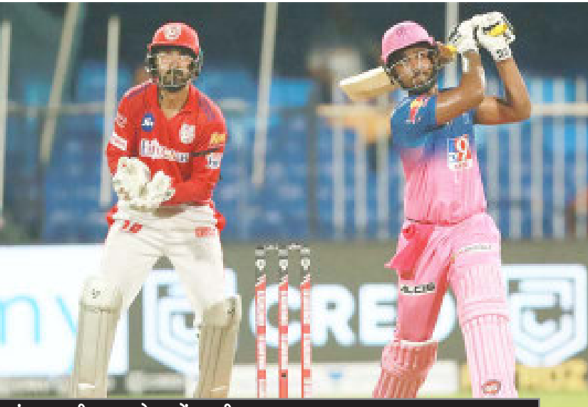
पंजाब की कमजोर गेंदबाजी

रॉयल्स के लिए अच्छी बात पंजाब की कमजोर गेंदबाजी है जिसमें शमी को छोड़कर ज्यादा अनुभवी गेंदबाज नहीं हैं। आदिल रशीद या रवि बिश्नोई पर स्पिन का दारोमदार रहेगा। तेज गेंदबाजी में अर्शदीप सिंह उतने मजबूत नहीं लग रहे। रॉयल्स टीम में तीसरे और चौथे विदेशी खिलाड़ी के रूप में क्रिस मौरिस, डेविड मिलर और दुनिया के नंबर एक टी-20 स्पिनर तबरेज शम्सी में से चयन किया जाएगा।