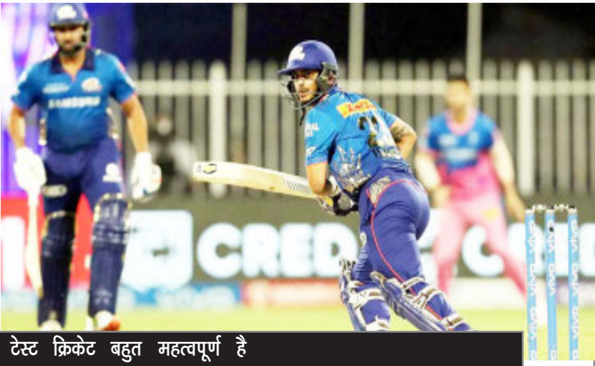
टेस्ट क्रिकेट बहुत महत्वपूर्ण है

रोहित ने मैच को लेकर आगे कहा, प्जब आप रडार में होते हैं तो आपको अपना काम करने की जरूरत होती है। सभी गेंदबाज साथ आए और हमारे लिए बेहतर किया। मुझे लगता है कि इस टूर्नामेंट में कोई भी टीम किसी को हराने की क्षमता रखती है। कोलकाता नाइट राइडर्स हमारे सामने खेल रहा है और हमें पता है क्या करना है। बता दें कि इशान किशन टी20 विश्व कप के लिए टीम इंडिया का हिस्सा हैं और उनका जल्दी से जल्दी लय पकड़ना न सिर्फ मुंबई के लिए, बल्कि भारतीय टीम के लिए भी अच्छी बात है। खुद रोहित शर्मा चाहते थे कि वे क्रीज पर समय बिताएं और उन्होंने ऐसा किया भी।