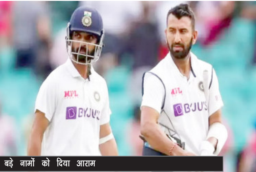
बड़े नामों को दिया आराम

हिटमैन को टेस्ट सीरीज में आराम दिया गया है। पिछले कुछ समय से टीम इंडिया के लिए सभी फॉर्मेट में खेल रहे विकेटकीपर बल्लेबाज ऋषभ पंत को भी आराम दिया गया है और जसप्रीत बुमराह भी टेस्ट टीम का हिस्सा नहीं हैं। ऋषभ पंत की जगह ऋद्धिमान साहा को विकेटकीपर बल्लेबाज के तौर पर चुना गया है। केएस भरत बैकअप विकेटकीपर हैं। मोहम्मद शमी और जसप्रीत बुमराह इस टेस्ट सीरीज का हिस्सा नहीं हैं।