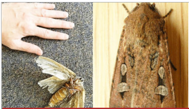
कभी चांद को भी ढंक लेता था यह पतंगा, अब अस्तित्व पर संकट

चीन पिछले कई दशकों से ताइवान के साथ राजनयिक रिश्ता रखने वाले देशों को अपने पाले में लाने के लिए काफी मशक्कत कर रहा है। इससे पहले चीन पनामा, अल सल्वाडोर और डोमिनिकन रिपब्लिकन को अपने पाले में ला चुका है।