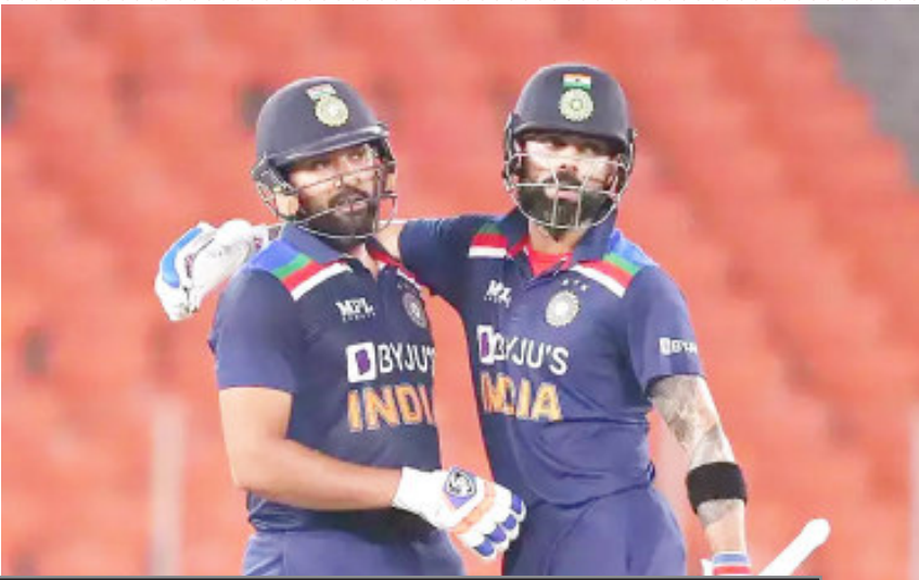
ये खिलाड़ी भी हैं रेस

सीमित ओवरों की क्रिकेट में उपकप्तान की रेस में केएल राहुल सबसे आगे हैं, लेकिन उनको विकेटकीपर बल्लेबाज रिषभ पंत से टक्कर मिल रही है। इसके अलावा जसप्रीत बुमराह भी सीमित ओवरों की उपकप्तानी हासिल करने वालों के दावेदारों में शुमार हैं, लेकिन भारतीय क्रिकेट के इतिहास में बहुत कम गेंदबाजों को उपकप्तानी या कप्तानी मिली है। ऐसे में श्रेयस अय्यर का दावा भी उपकप्तान के लिए मजबूत लग रहा है, जो अब तीनों फार्मेट में रन बना रहे हैं।