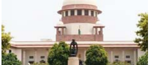
दिल्ली पुलिस को शाहीन बाग इलाके को खाली कराने के लिए कार्रवाई करनी चाहिए। -सुप्रीम कोर्ट

सुप्रीम कोर्ट ने कहा है कि विरोध प्रदर्शन एक सीमा तक हों, अनिश्चितकाल तक नहीं