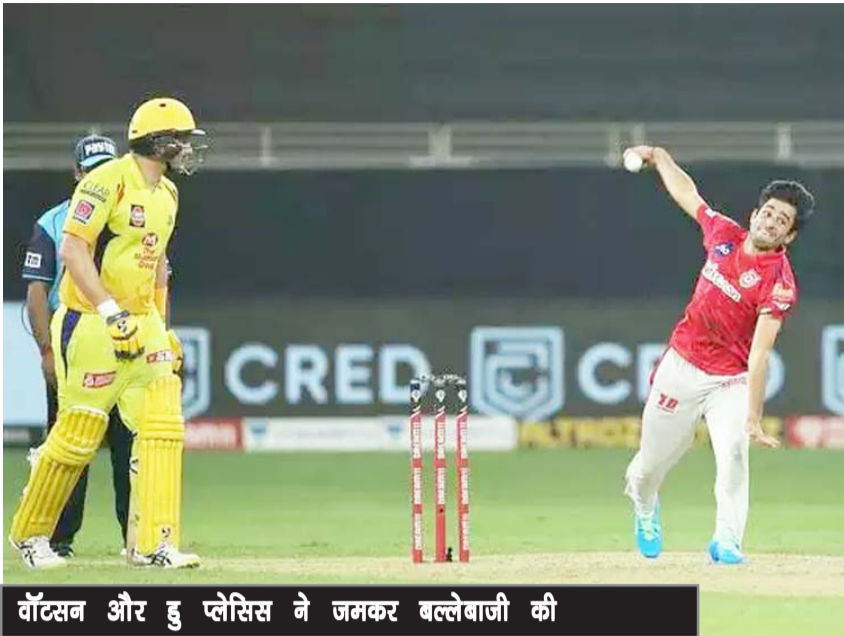
वॉटसन और डु प्लेसिस ने जमकर बल्लेबाजी की

शेन वॉटसन और फाफ डु प्लेसिस ने विकेट पर जमकर बल्लेबाजी की। इस दोनों ने अपने अनुभव का पूरा फायदा उठाया और पंजाब के गेंदबाजों को कोई कामयाबी हाथ नहीं लगने दी। वॉटसन ने 53 गेंद पर 83 और डु प्लेसिस ने 53 गेंद पर नाबाद 87 रन की पार्टनरशिप की। चेन्नै ने 17.4 ओवर में बिना कोई विकेट खोए 181 रन बनाकर मैच जीत लिया।