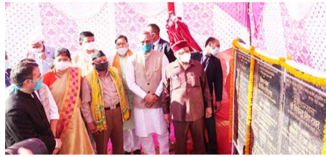
योजनाओं का शिलान्यास व लोकार्पण करते सीएम।

व प्रोत्साहन को ध्यान में रखते हुए प्रदेश में युवाओं के लिए खेलनीति बनाई गयी है। हमारी आने वाली पीढ़ी स्वस्थ हो इसके लिए सौभाग्यवती योजना शुरू की जा रही है। यह बात मुख्यमंत्री ने जनपद बागेश्वर में विभिन्न विकास कार्यों के शिलान्यास एवं लोकार्पण के अवसर पर कही। मुख्यमंत्री ने कहा कि प्रदेश सरकार विकास को प्राथमिकता देते हुए अपना कार्य कर रही है। साढ़े तीन वर्षों में प्रदेश सरकार ने अपनी साफ सुथरी छवि बनाई है, इसी का परिणाम है कि इस अवधि में कोई भी भ्रष्टाचार का मामला नहीं आया। कोविड के दौरान भी प्रदेश सरकार ने विकास