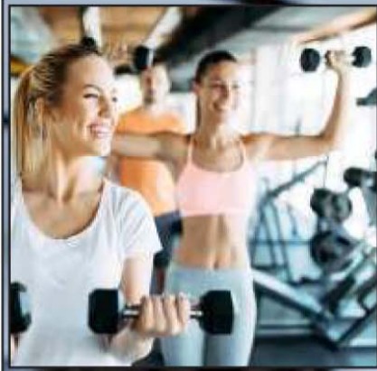
एजेंसी (वेब वार्ता न्यूज)

इंफेक्शन का खतरा: एक्सर्साइज करते वक्त खूब सारा पसीना निकलता है। ऐसे में अगर आप अपने चेहरे पर एक्सर्साइज करते वक्त मेकअप लगाकर रखेंगी तो बैक्टीरिया आने की आशंका बढ़ जाएगी क्योंकि मेकअप बैक्टीरिया