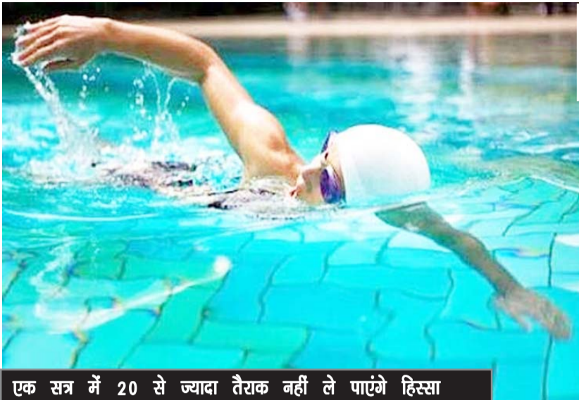
एक सत्र में 20 से ज्यादा तैराक नहीं ले पाएंगे हिस्सा

एसओपी के अनुसार केंद्र के प्रमुख, कोच व प्रभारी की जिम्मेदारी है कि वे प्रशिक्षण प्रोटोकॉल का पूर्ण पालन सुनिश्चित करें। खिलाड़ियों और कर्मचारियों द्वारा परिसर में फिर से ट्रेनिंग शुरू करने से पहले संक्रमण-मुक्त स्थिति की जानकारी कोविड टास्क फोर्स के अधिकारियों को प्रदान करनी होगी। कोरोना वायरस के कारण देशभर में स्विमिंग पूल मार्च से बंद थे। अब उन्हें कंटेनमेंट जोन के बाहर के क्षेत्रों में 15 अक्टूबर से खिलाड़ियों के प्रशिक्षण के लिए फिर से खोलने की अनुमति दी गई है।