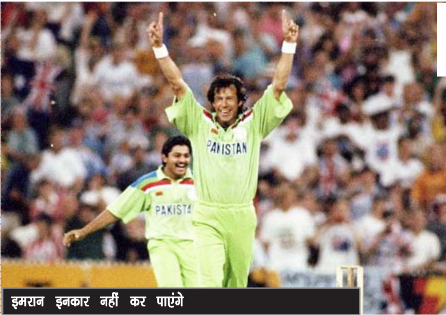
इमरान इनकार नहीं कर पाएंगे

सरफराज ने कहा, वह कुछ सूंघते भी हैं, वह भांग का भी सेवन करते हैं। वह ऐसा लंदन और यहां तक कि मेरे घर में ऐसा करते रहे हैं। 1987 में जब पाकिस्तान और इंग्लैंड का मुकाबला हो रहा था, तो उन्होंने अच्छी गेंदबाजी नहीं की। वह मेरे घर आए और साथ में मोहसिन खान, अब्दुल कादिर और सलीम मलिक भी थे। खाने के बाद उसने चरस पी थी।