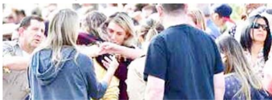
बच्चों की मौत से हर आंख नम।

लास एंजिलिस काउंटी के शेरिफ एलेक्स विलानुएवा ने बताया कि 16 वर्षीय संदिग्ध समेत 6 लोगों को गोली