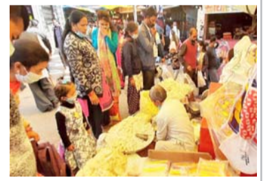
बाजारों में दोपहर के एक बजे से लेकर रात नौ बजे तक खरीददारी करते दिखे लोग

संवाददाता पिथौरागढ़। जिले में शुक्रवार को धनतेरस को लेकर खासा भीड़-भाड़ देखने को मिली। बता दें कि जिले में ग्रामीण व स्थानीय लोगों ने जमकर खरीददारी भी की। जिले में कोरोना संक्रमण के चलते भी लोगों ने मुख्यालय के बाजारों में आकर जमकर खरीददारी की। इस बार जिले में लोगों द्वारा इलेक्ट्रॉनिक सामग्री के साथ बर्तन रेडीमेड सामग्री व पूजा पाठ के सामान की जमकर खरीददारी की। जिले में शुक्रवार दोपहर एक बजे से लेकर रात्रि नौ बजे तक जमकर खरीददारी की। वहीं लोगों ने दीप पर्व को लेकर आतिशबाजी व दीये की भी खरीददारी की। इस बार जिले में चाइनीज सामग्री का क्रेज कम ही देखने को मिला। लोगों ने दीपावली को लेकर कपडे, इलेक्ट्रॉनिक सामग्री कपडे पूजा पाठ की सामग्री की काफी खरीददारी करते हुए लोग देखे गये। जिले में स्थानीय लोगों व