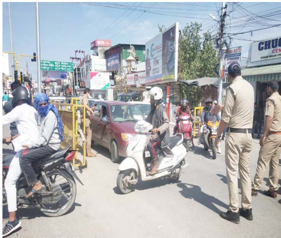
लॉकडाउन के पहले दिन कुछ ऐसा रहा दून का नजारा।

यू तो प्रधानमंत्री नरेंद्र मोदी की अपील पर रविवार को पूरे देश में रजनता कर्फ्यू को जोरदार समर्थन मिला। हालांकि, कुछ ऐसे भी लोग थे जिन्होंने न तो प्रधानमंत्री की अपील की परवाह की और न ही खुद या अपने परिजन, चहेतों के स्वास्थ्य की चिंता और निकल पड़े बेखौफ तमाशा देखने घरों से निकल पड़े। इसलिए, इतना तो कहा जा सकता है कि अगर ऐसे चंद लोगों के लिए पूरे देश को कर्फ्यू का सामना करना पड़े तो भी ये भी स्वीकार।