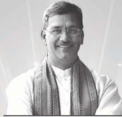
त्रिवेन्द्र सिंह रावत मुख्यमंत्री, उत्तराखण्ड

एजेंसी (वेब वार्ता न्यूज) नई दिल्ली। पूर्व गृह मंत्री पी चिदंबरम ने केंद्र सरकार को घेरते हुए कहा कि एनआरसी, सीए और एनपीआर एक ही सिक्के के दो पहलू हैं। उन्होंने कहा कि असम में एनआरसी के कारण 19 लाख से अधिक लोगों की नागरिकता चली गई और सरकार को अभी भी लगता है कि कोई दिक्कत नहीं है। कांग्रेस सरकार में एनपीआर लाया गया था, लेकिन वह जनगणना के लिए था, लेकिन मौजूदा सरकार इस मुद्दे पर आगे बढ़ती जा रही है।