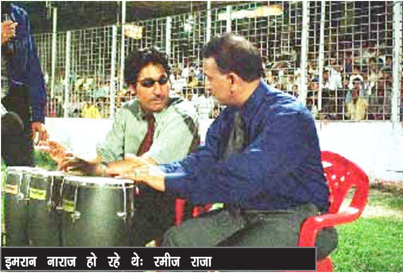
इमरान नाराज हो रहे थे: रमीज राजा

क्रिकेटर से कॉमेंटेटर बने रमीज राजा ने कहा, जब मैं पहली बार गावसकर से मिला तो वह मुझे गॉड की तरह लगे। मैं शॉर्ट लेग पर खड़ा था। इमरान खान, सुनील गावसकर को आउट करने की भरपूर कोशिश कर रहे थे। गावसकर ऑफ स्टंप के बाहर की गेंदों को छोड़ रहे थे और सही गेंद का इंतजार कर रहे थे। रमीज बोले— इमरान ने तब बताया था, गावसकर इनस्विंग बॉल को भी आसानी से सीमा रेखा के बाहर पहुंचा रहे थे। जवाब में इमरान नाराज हो रहे थे। इसके बावजूद वह मुझे गावसकर से सीखने को कह रहे थे।